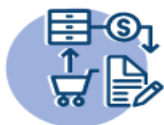
Figura 1: Situação atual da implantação do SIGADMIN.